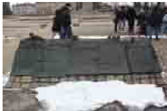
Monumento eretto a ricordo dei morti del 1970 nel piazzale antistante il Cancelli N.2 dei Cantieri Navali Lenin di Danzica.