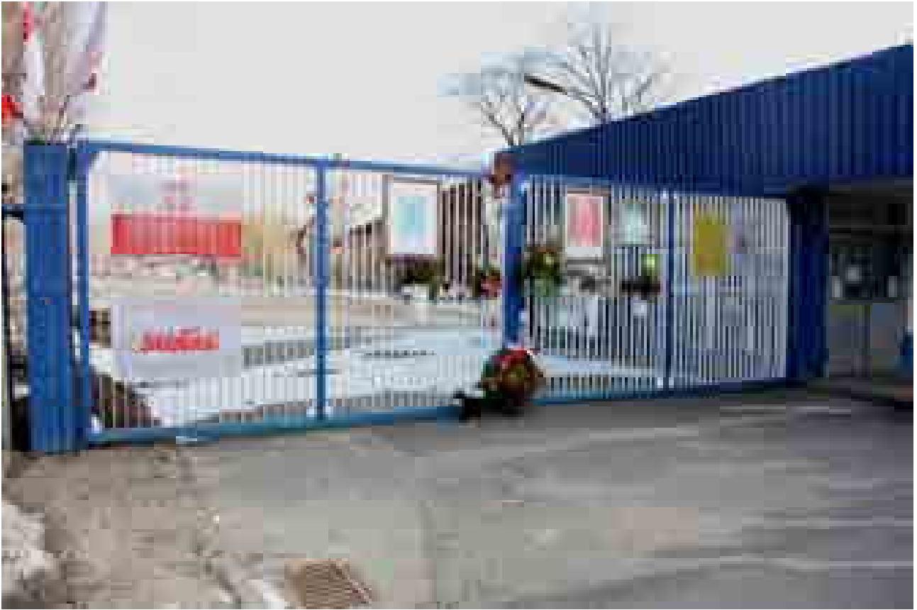
I Cancelli del Cantiere Navale di Danzica