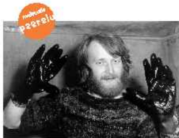
DRUGI OBIĘG 1976 - 1989