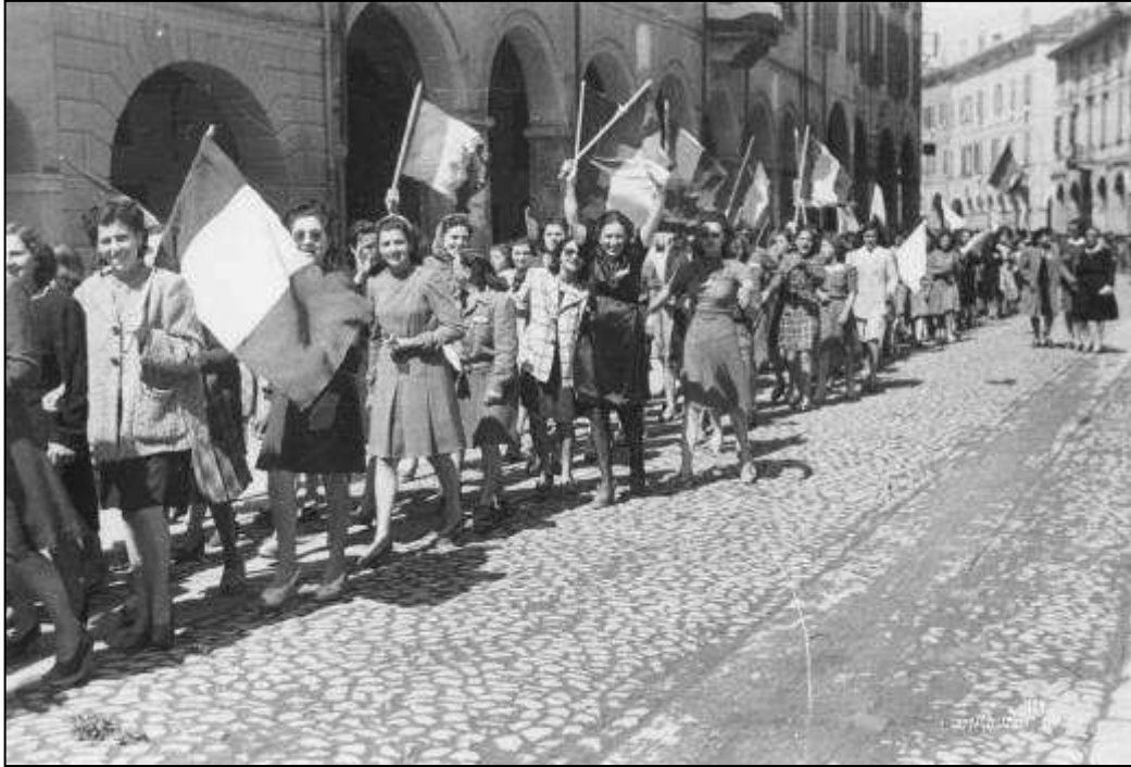
Le donne correggesi sfilano in Corso Mazzini per festeggiare la Liberazione (1945)