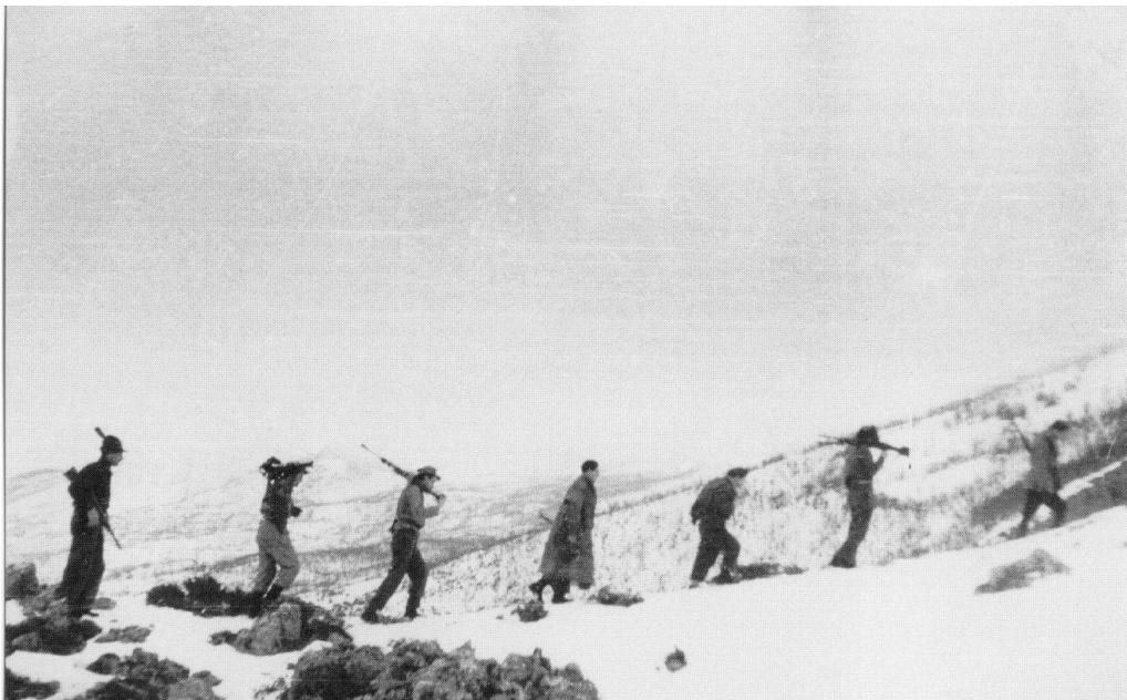
Partigiani in marcia sulle montagne reggiane (1945)

Voi siete giovani, cercate di sostenere l'ANPI e fate in modo che i nostri valori siano sempre rispettati e che i nostri principi siano sempre vivi perché voi avete davanti tutta la vita, cercate di tenerli alti. Non è una questione dell'ANPI di per se stessa, sono i valori che contano, fate così anche con gli altri. Io cerco sempre di reclutare dei giovani e di farli iscrivere all'ANPI, che è una associazione apartitica, per mantenerne vivi i nostri valori. Niente cade dal cielo, quello che voi avete oggi l'avete trovato grazie ai nostri sacrifici. A voi spetta di tenerli in vita, perché c'è sempre qualcuno che tenta di...Poi avete visto, abbiamo ancora i fascisti al governo... dobbiamo cercare di fermarli e sforzarci di tenere in vita i nostri principi e non i loro. Forse dopo andrete meglio.