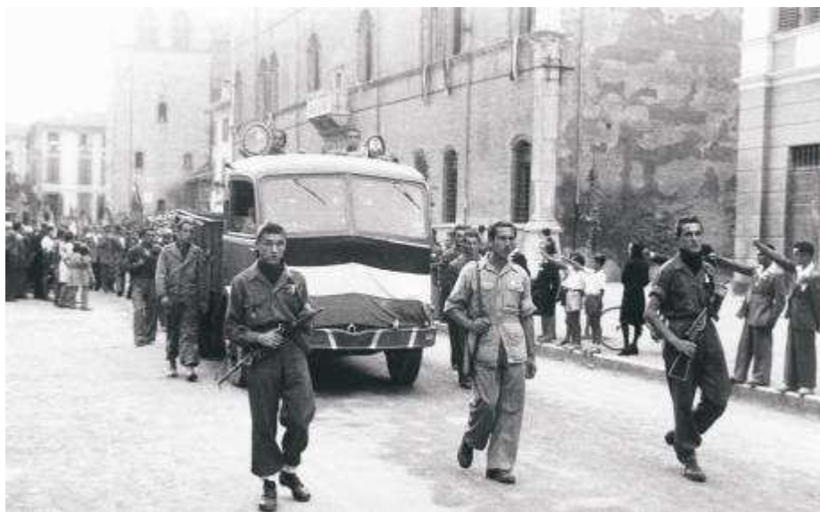
Partigiani sfilano in corso Cavour, durante i funerali solenni di tutti i caduti della Resistenza correggese (1945)

All'indomani della Liberazione mi capitò di andare ad arrestare il commissario prefettizio di Correggio, che era la più alta autorità amministrativa, alle dirette dipendenze dei tedeschi. Non sapevo neanche chi fosse. Lui viveva in via Asioli. Arrivato là lui non voleva saperne di farsi arrestare ed opponeva resistenza. mi toccò tirare fuori la pistola, perchè non voleva saperne di farsi arrestare. Poi riuscii a portarlo in carcere. Se io fossi stato uno di quelli violenti e non avessi usato il concetto democratico che mi avevano insegnato quelli che sapevano più di me, avrei potuto ucciderlo subito, visto che aveva opposto resistenza. Se avessi fatto la stessa cosa con quel prete, sarei stato un incosciente. In guerra ci sono situazioni in cui è difficile far sopravvivere i buoni comportamenti.